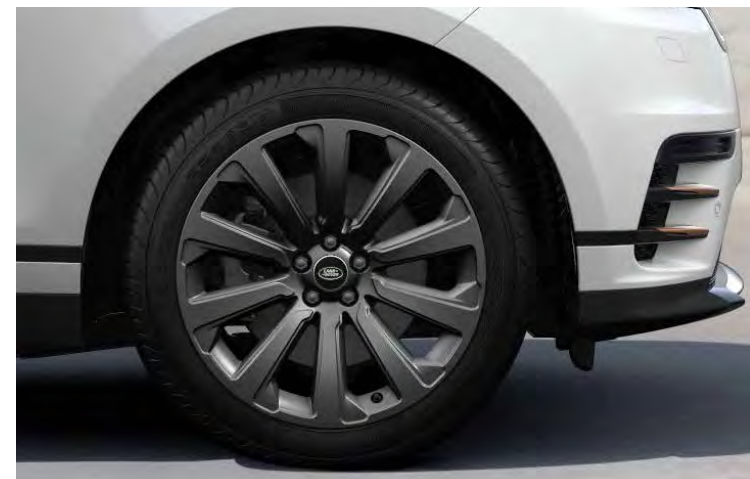
20" 10-SPOKE 'STYLE 1032' SATIN DARK GREY Standaard op Range Rover Velar R-Dynamic SE