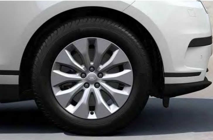
18" 10-SPOKE 'STYLE 1021' GLOSS SPARKLE SILVER

Er is keuze uit een uitgebreid programma lichtmetalen velgen. De maten variëren van 18" tot een bijzonder aantrekkelijke 22". De markante designkenmerken voegen stuk voor stuk hun specifieke karakter toe aan de uitstraling van de auto. In de configurator op landrover.nl kunt u zien welke velgen beschikbaar zijn voor uw gewenste uitvoering.