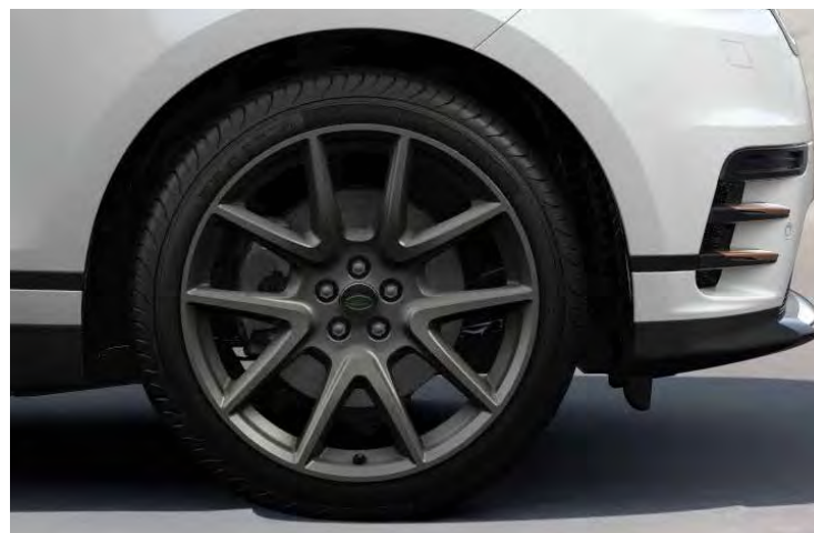
21" 5-SPOKE 'STYLE 5109' SATIN DARK GREY Standaard op Range Rover Velar R-Dynamic HSE