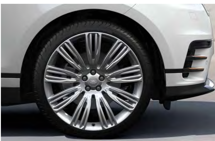
22" 9-SPLIT SPOKE 'STYLE 9007' GLOSS SPARKLE SILVER