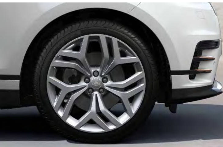
21" 5-SPLIT SPOKE 'STYLE 5047' GLOSS SPARKLE SILVER