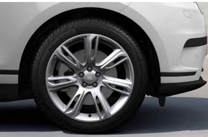
20" 7-SPOKE 'STYLE 7014' GLOSS SPARKLE SILVER Standaard op Range Rover Velar SE