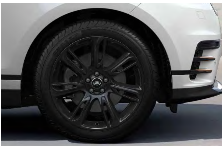
20" 7-SPOKE 'STYLE 7014' GLOSS BLACK