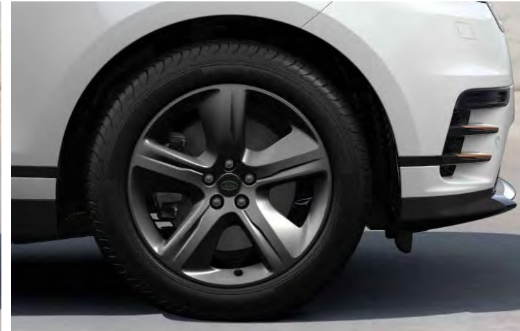
19" 5-SPOKE 'STYLE 5108' SATIN DARK GREY Standaard op Range Rover Velar R-Dynamic S