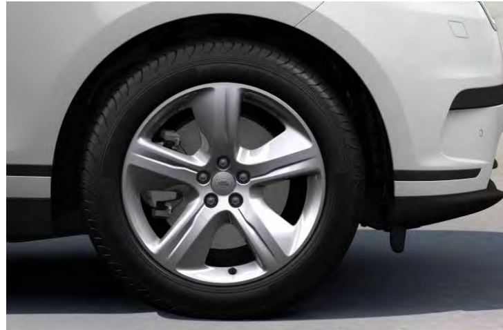
19" 5-SPOKE 'STYLE 5108' GLOSS SPARKLE SILVER Standaard op Range Rover Velar & Range Rover Velar S